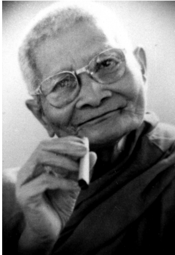
หลวงปู่แหวน สุจิณฺโณ (๑๖ ม.ค. ๒๔๓๐ - ๒ ก.ค. ๒๕๒๘)

หากว่าในขณะที่เรามาบำเพ็ญสมาธิภาวนาทำให้จิตมีสมาธิสงบนิ่ง รู้ ตื่น เบิกบาน บรรลุปฐมฌาน ทุติยฌาน ตติยฌาน จตุตถฌาน ตามลำดับหรือมีสมาธิแน่นแน่วรู้ธรรมเห็นธรรม ในช่วงนั้นกายของเราเป็นมนุษย์ แต่จิตใจของเราก็เป็นพระพรหม พระพรหมคือผู้มีใจสว่างไสวเบิกบานแจ่มชื่น