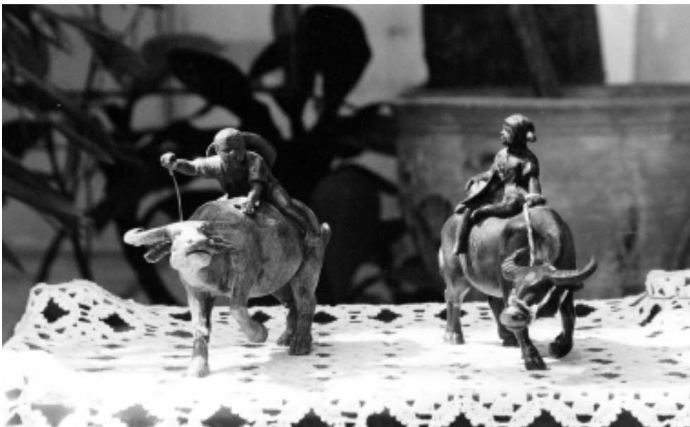
รูปปั้นเด็กขี่ควายที่หลวงพ่อกับคนไปซื้อมาไว้ในกุฏิที่วัดป่าสาละวัน

สมัยหลวงพ่อนุ่ม ๆ น้อย ๆ อยู่ วัตถุไม่ค่อยมีมาก แต่สมัยก่อนมีความร่มเย็นเป็นสุขมากกว่าสมัยปัจจุบันนี้ที่มีวัตถุมาก ๆ ในสมัยก่อนมันร่มเย็นเป็นสุขมากกว่าสมัยปัจจุบันนี้ แม้แต่ความเป็นอยู่ของชาว