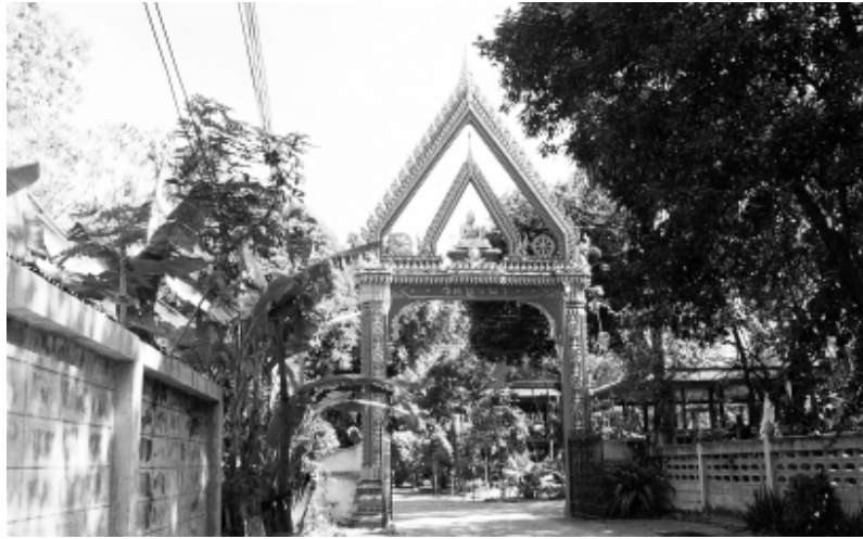
วัดบูรพาราม อำเภอเมือง จังหวัดอุบลราชธานี