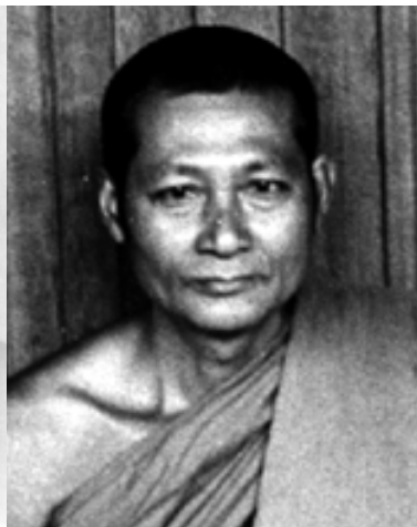
พระอุดมสังวรคุณ (วัน อุตตโม)